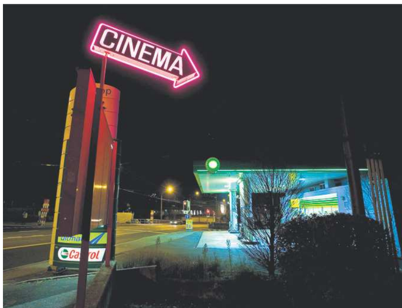
Le City Club de Pully vient de renaître grâce à une association. Mais son avenir est loin d'être assuré. CHRISTIAN BRUN

Les communes investissent pour aider les exploitants à passer le cap du numérique